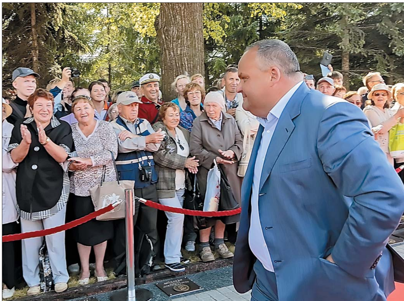
При Ласточкине Рыбинск постепенно начал всё больше и больше напоминать небольшие европейские города.