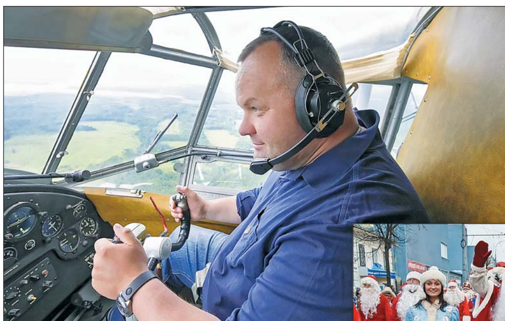
В 2012 году мэр города лично возглавил шествие по центральным улицам Рыбинска, в котором приняло участие более 1200 Дедов Морозов и Снегурочек.